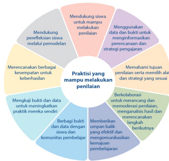
Gambar 2. Praktisi yang Mampu Melakukan Penilaian

Validitas yang digunakan dalam penelitian ini adalah validitas konstruk, yaitu menggunakan pendapat dari para ahli yaitu dua guru Bahasa Inggris SD dan SMP sekolah YPJ Kualan Kencana dan satu guru Bahasa Inggris SD sekolah YPJ Tembapapura untuk melihat dan menilai instrumen yang sudah dikonstruksi oleh peneliti yang diambil dari aspek-aspek yang akan diukur berdasarkan teori-teori tertentu yaitu: kemampuan pemahaman berbahasa Inggris dan sistem penilaian. Variabel sistem penilaian diukur dengan angket dengan 15 butir pertanyaan “Sistem penilaian dalam Bahasa Inggris”, menggunakan skala Likert interval 1 sampai 3 dengan jawaban Ya, Kadang-kadang, Tidak. Uji Validitas \alpha = 0,05 ; df = 43-2 = 41 r\text{-tabel} = 0,2542 . Nilai Corrected Item-Total Correlation pada semua butir pertanyaan lebih dari 0,2542 maka butir-butir pertanyaan tersebut valid. Uji Reliabilitas Nilai Cronbach’s Alpha = 0,973 > 0,70 maka butir-butir pertanyaan tersebut reliabel.